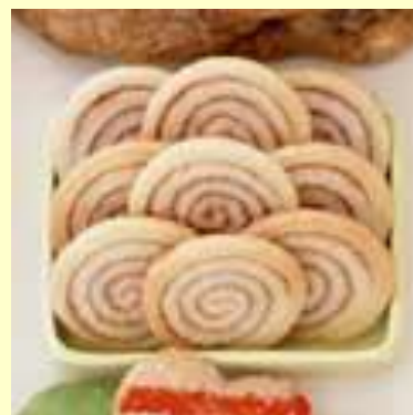
El bocadillo perfecto mientras lees